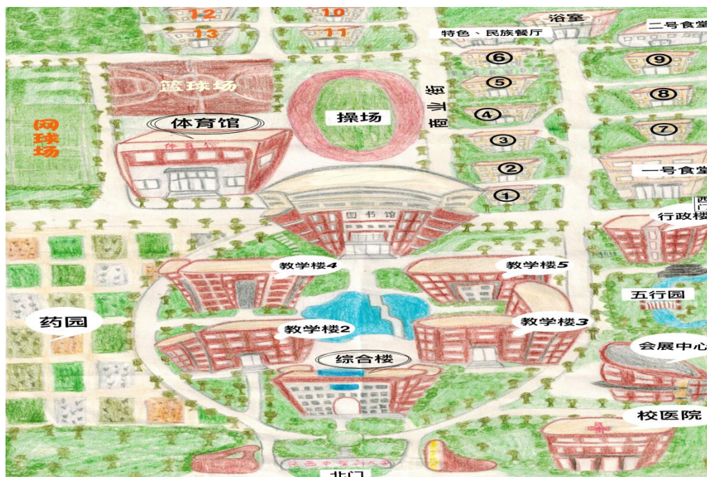
陕西中医药大学南校区总览图