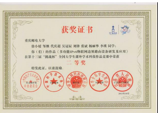
第十三届“挑战杯”全国大学生课外学术科技作品竞赛全国二等奖