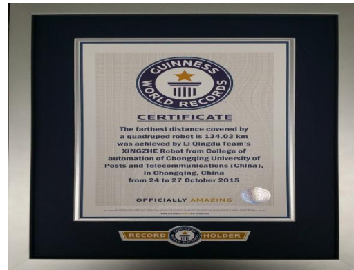
吉尼斯世界纪录认证