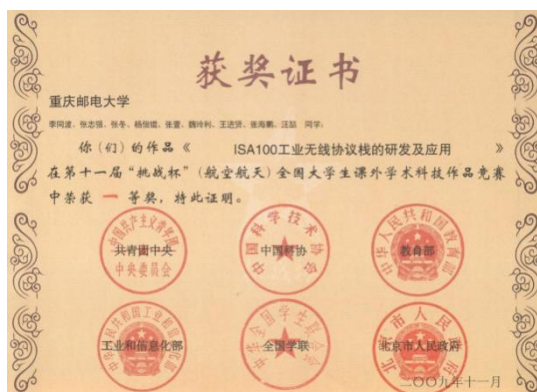
第十一届“挑战杯”全国大学生课外学术科技作品竞赛全国一等奖

自动化学院注重校园文化方面的建设，重视研究生综合素质能力的培养。为促进学生专业提升与发展，拓宽学生眼界，先后邀请姚建铨等国内外知名专家学者到我院讲学。鼓励研究生积极参加学术科研和学生科技竞赛活动，近五年来，我院研究生申请发明专利 300 余项、已经授权 120 余项，在 Automatica、IEEE Trans AUTOMAT Contr 等期刊发表 SCI 一区论文 30 余篇，ESI “热点论文”和“高被引论文” 2 篇，获“挑战杯”大学生课外学术科技作品竞赛、“互联网+”大学生创新创业大赛、全国研究生数学建模竞赛等国家级奖励 50 余项。多名研究生参与了全球首款工业物联网核心芯片“渝芯一号”的研发。研究生参与研发的“行者一号”机器人打破吉尼斯世界纪录，毕业后成立了重庆洽派机器人科技有限公司，研制了世界上首个足式助行机器人“行者二号”荣获 2016 国际工业设计大赛（深圳）十大创新科技产品。我院研究生参加了美国、日本、韩国等多国组织的国际会议及文化交流活动。同时，打造了丰富多彩的校园文化活动，如：研究生毕业晚会、趣味运动会、素质拓展活动等。