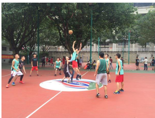
研究生同心杯篮球赛