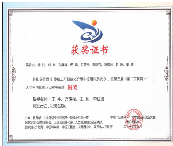
第三届中国“互联网+”大学生创新创业大赛全国铜奖