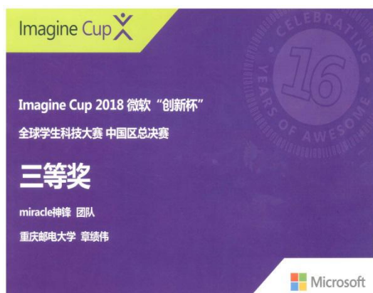
“微软创新杯”全球学生科技大赛 中国区总决赛全国三等奖