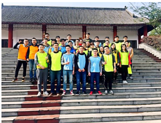
研究生素质拓展活动