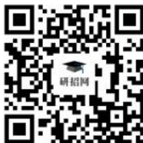
图 1 网上确认入口二维码