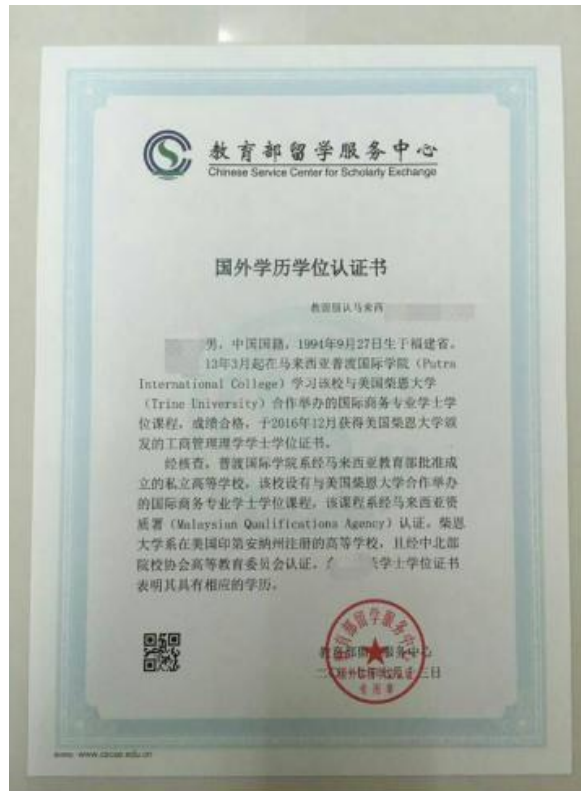
图 8 教育部留学服务中心出具的认证报告照片示例图