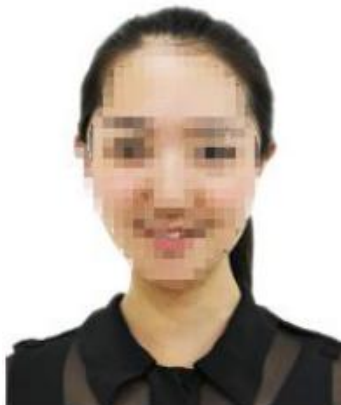
图 2 准考证照片示例图