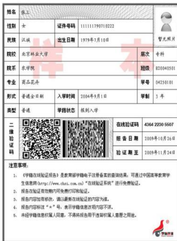
图7 教育部学籍在线验证报告照片示例图