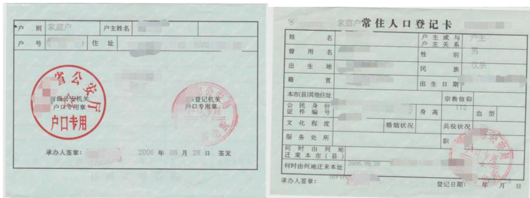
图 9 户口本照片示例图